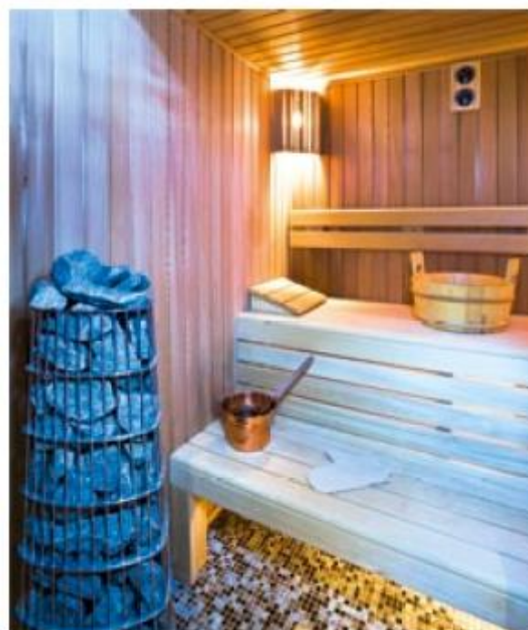
DC84 może znaleźć zastosowanie w najbardziej ekstremalnych warunkach, nawet w saunie