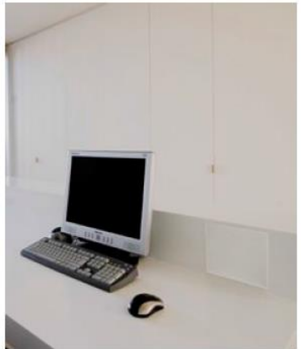
FL301 to głośnik nie tylko dyskretny, ale też wszechstronny. Na ilustracji zamontowany nad blatem biurka.